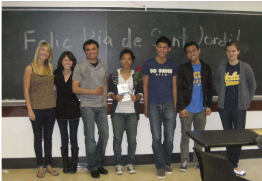
Estudiants de català a UCLA

Only that which is good, only that, and with that I leave you, So that you look for what is to come.