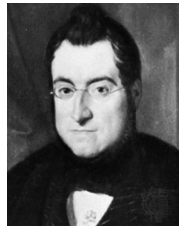
Bonaventura Carles Aribau

(*) Bonaventura Carles Aribau (1798-1862), Catalan and Spanish writer, politician and economist.